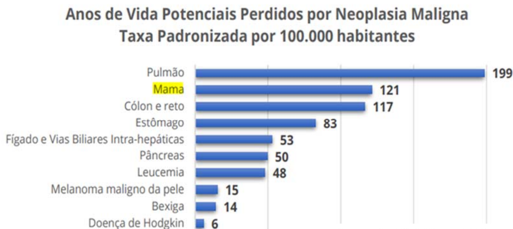
Figura 1: 2019

Uma das neoplasias mais frequentemente identificadas foi o cancro da mama, por anos de vida potenciais perdidos por neoplasias malignas (Figura 1).